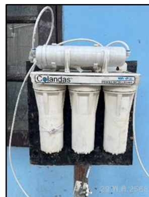
ภาพที่ 46 น้ำดื่มสำหรับพนักงาน