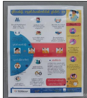
ภาพที่ 69 ป้ายประชาสัมพันธ์ COVID-19