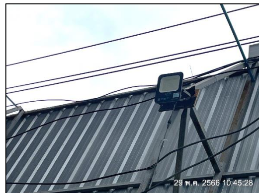
ภาพที่ 30 ไฟฟ้าส่องสว่างภายในโครงการ