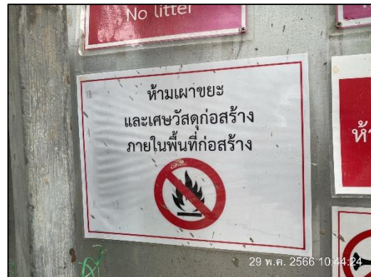
ภาพที่ 17 ป้ายห้ามเผาขยะ และเศษวัสดุก่อสร้าง