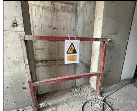
ภาพที่ 65 ราวกันตกหรือตาข่ายนิรภัย