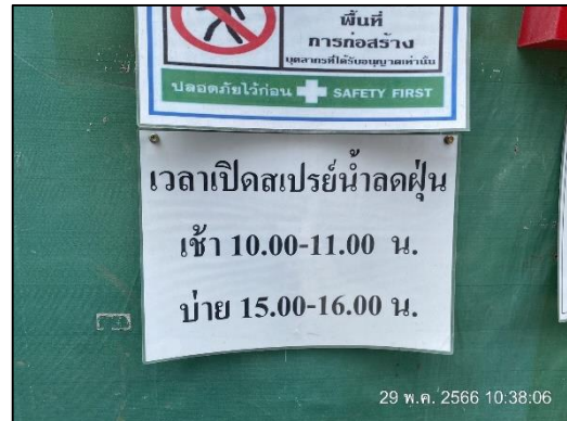
ภาพที่ 11 สเปรย์น้ำบริเวณรั้ว Metal Sheet