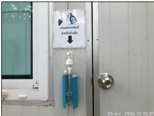
ภาพที่ 49 จุดบริการเจลแอลกอฮอล์