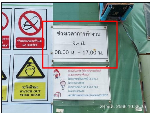
ภาพที่ 18 ป้ายกำหนดช่วงเวลาทำงาน