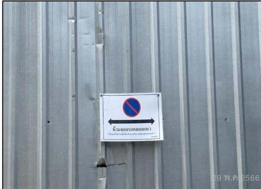
ภาพที่ 31 ป้ายห้ามจอดรถ