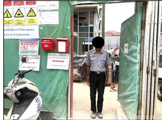
ภาพที่ 21 เจ้าหน้าที่รักษาความปลอดภัย