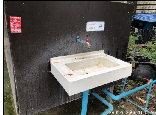
ภาพที่ 48 อ่างล้างมือ