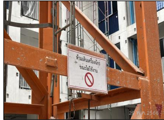
ภาพที่ 15 ป้ายไม่เดินเครื่องจักรขณะไม่ใช้งาน