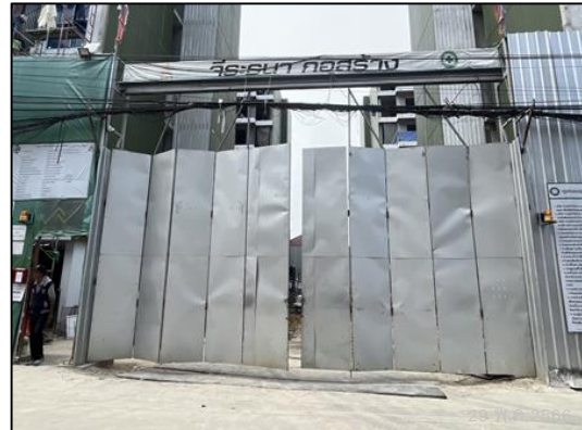
ภาพที่ 9 ประตูเข้า-ออกปิดทึบ