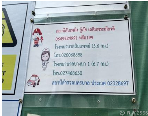
ภาพที่ 6 หมายเลขติดต่อฉุกเฉิน