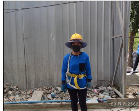
ภาพที่ 45 อุปกรณ์ป้องกันอันตรายส่วนบุคคล