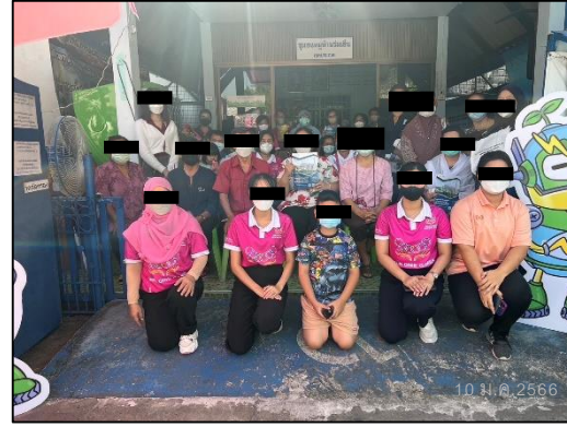
ภาพที่ 71 ประชาสัมพันธ์โครงการและมอบของขวัญแก่ชุมชนใกล้เคียง