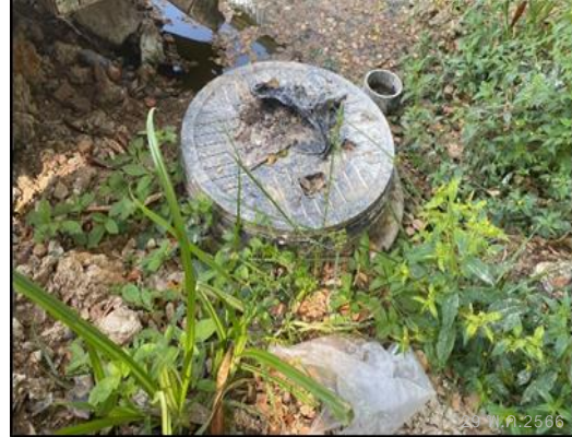
ถังบำบัดน้ำเสียสำเร็จรูป