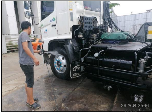
ภาพที่ 14 กิจกรรมล้างล้อรถบรรทุก