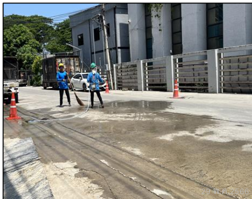
ภาพที่ 8 กิจกรรมพรมน้ำบริเวณโครงการ