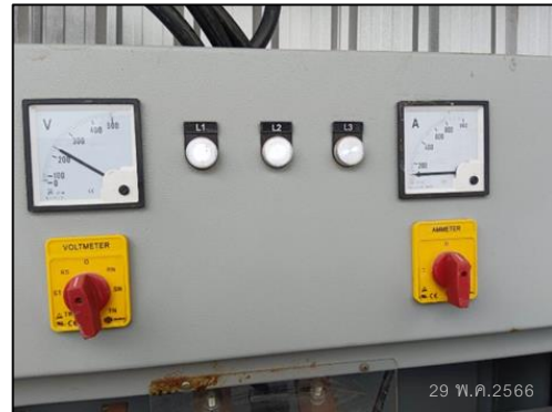
ภาพที่ 34 ตู้ MDB สำหรับเปิดและตัดไฟ