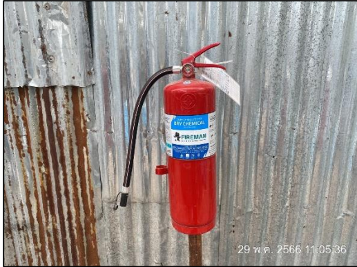
ถังดับเพลิง