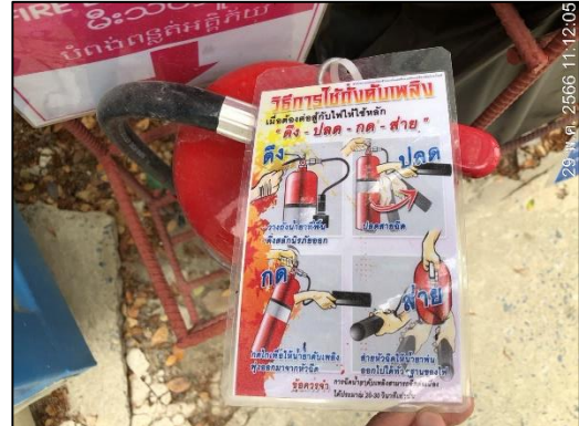
ภาพที่ 37 ถังดับเพลิงและการใช้งาน