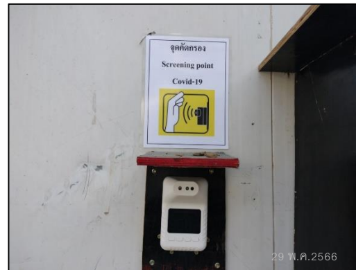
ภาพที่ 50 จุดคัดกรอง COVID-19