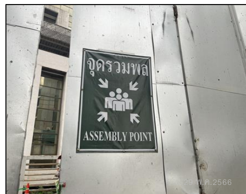
ภาพที่ 36 จุดรวมพล