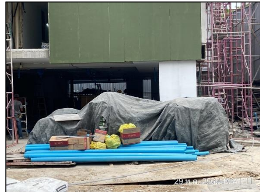
ภาพที่ 7 ผ้าใบคลุมกองวัสดุก่อสร้าง