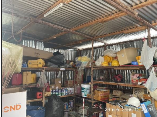
ภาพที่ 4 Store จัดเก็บวัสดุอุปกรณ์ก่อสร้าง