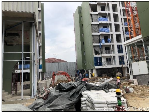
ภาพที่ 1 สภาพโครงการปัจจุบัน