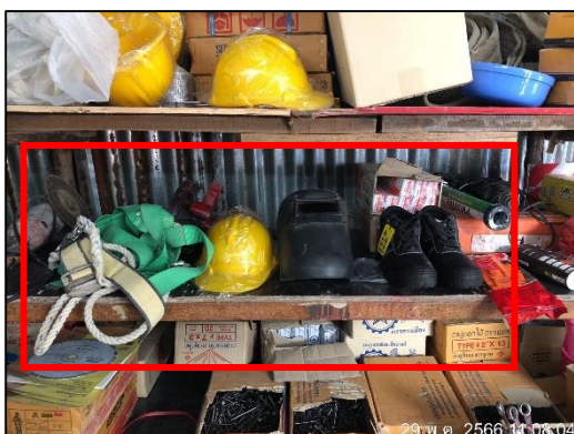
ภาพที่ 45 (ต่อ) อุปกรณ์ป้องกันอันตรายส่วนบุคคล