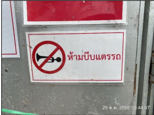
ภาพที่ 20 ป้ายห้ามป๊บแตร