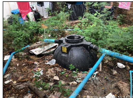
ภาพที่ 52 ถังบำบัดน้ำเสียสำเร็จรูป