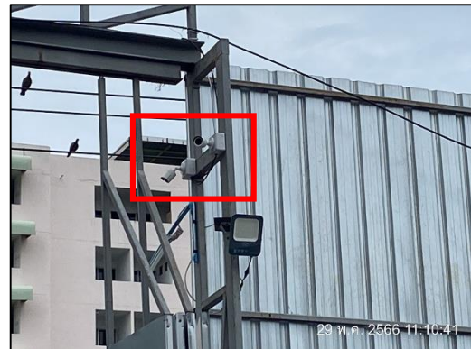
กล้องวงจรปิดบริเวณบ้านพักคนงาน