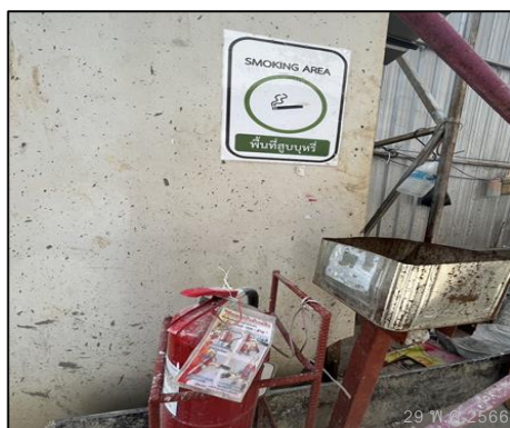
ภาพที่ 51 พื้นที่สูบบุหรี่