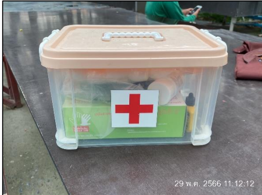
ภาพที่ 42 อุปกรณ์ปฐมพยาบาล