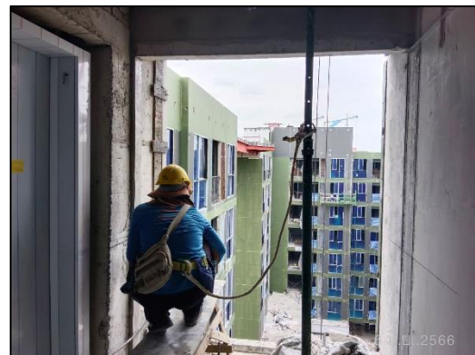
ภาพที่ 67 คนงานสวมอุปกรณ์ป้องกันขณะอยู่บนที่สูง