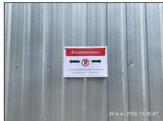
ภาพที่ 23 ป้ายห้ามจุดดวดบริเวณโครงการ