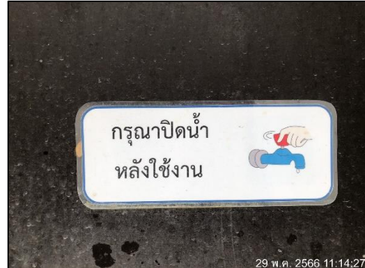
ภาพที่ 32 ป้ายประหยัดน้ำ