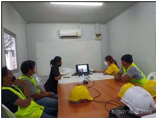
ภาพที่ 44 กิจกรรมอบรมพนักงานใหม่