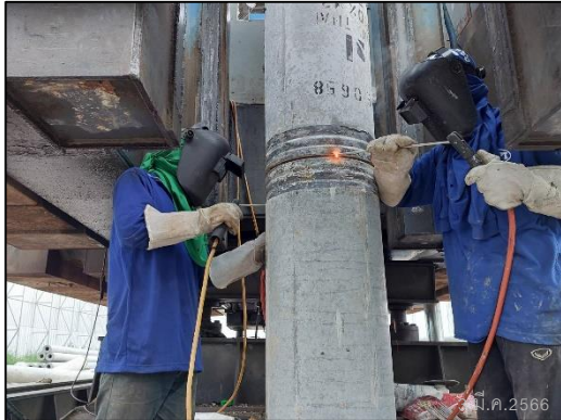
ภาพที่ 64 คนงานสวมชุดอุปกรณ์ป้องกันขณะปฏิบัติงานเกี่ยวกับความร้อน