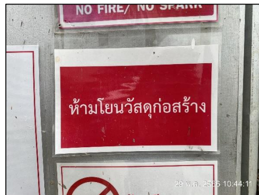
ภาพที่ 19 ป้ายห้ามโยนวัสดุก่อสร้าง