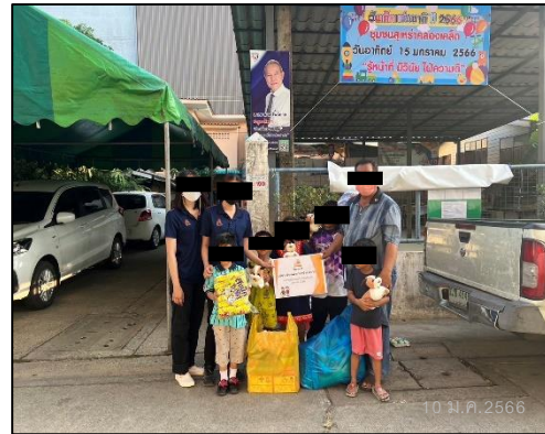
ภาพที่ 71(ต่อ) ประชาสัมพันธ์โครงการและมอบของขวัญแก่ชุมชนใกล้เคียง