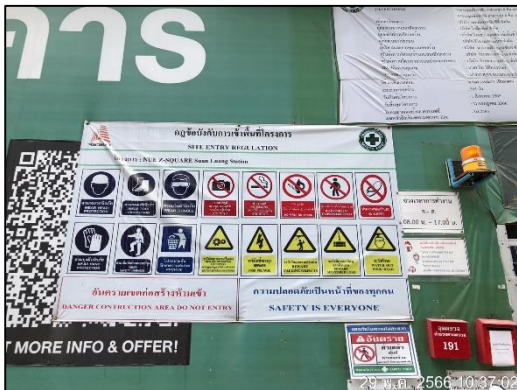
ภาพที่ 22 ป้ายกฎข้อบังคับการเข้าพื้นที่โครงการ