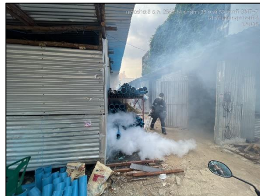
ภาพที่ 70 กิจกรรมฉีดพ่นควันกำจัดยุงและแมลง