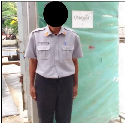
เจ้าหน้าที่รักษาความปลอดภัย