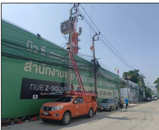
ภาพที่ 35 ประสานเจ้าหน้าที่เชื่อมต่อไฟฟ้า