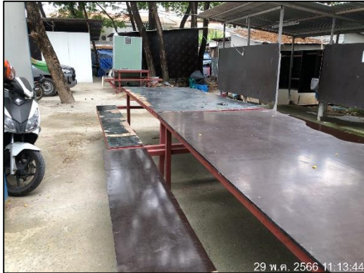
ภาพที่ 47 พื้นที่พักผ่อนสำหรับพนักงาน