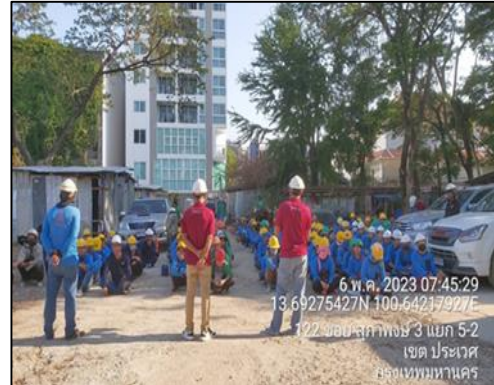
ภาพที่ 43 กิจกรรม Morning Talk