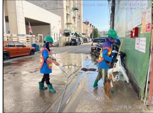
ภาพที่ 10 กิจกรรมทำความสะอาดภายในพื้นที่โครงการและด้านหน้าโครงการ