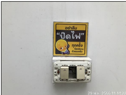
ภาพที่ 33 ป้ายประหยัดไฟ