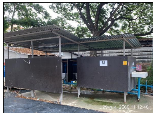
ภาพที่ 24 ห้องน้ำสำหรับคนงาน