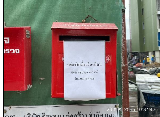
ภาพที่ 5 กล่องรับความคิดเห็น