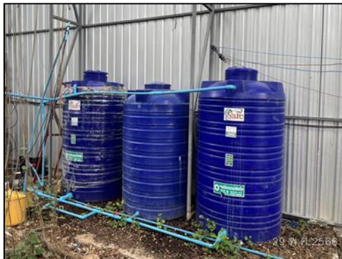
ภาพที่ 16 ถังน้ำสำรองใช้