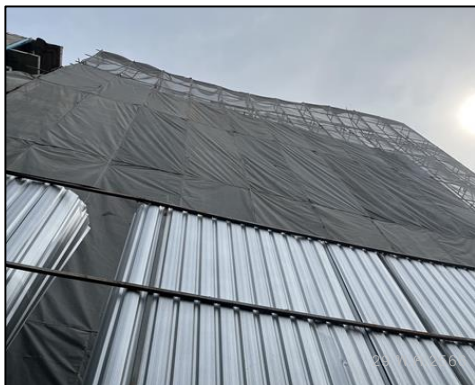
ภาพที่ 66 Mesh Sheet คลุมอาคาร