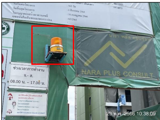
ภาพที่ 29 สัญญาณไฟกระพริบน้าโครงการ